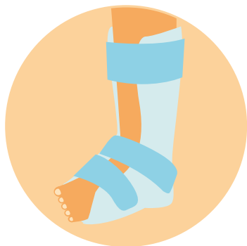
ÓRTESIS (DAFO) PIE