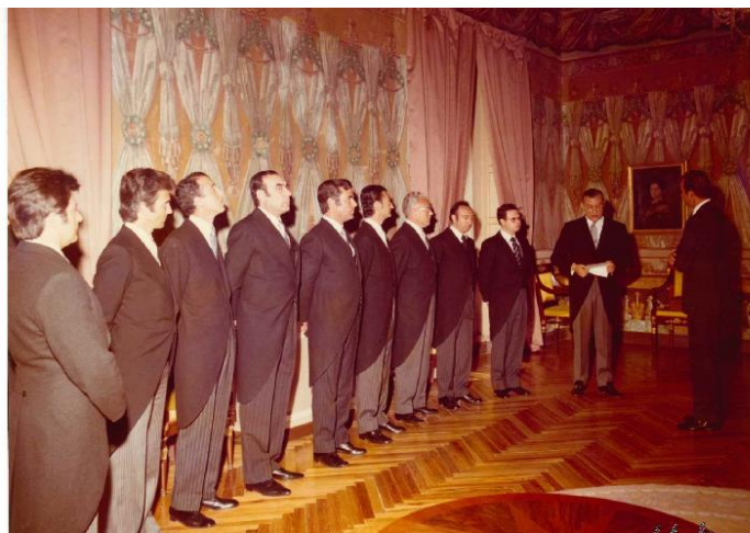
Figura 3. Entrega de la Revista de Química Textil.